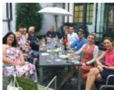
Teilnehmer des OPEN-BAR Events

Besonderer Fokus liegt auf dem Festakt zum 70-jährigen Jubiläum von DIE FAMILIENUNTERNEHMER am 6. November 2019. Das rauschende Fest wird im goldenen Rathaussaal Nürnbergs stattfinden.