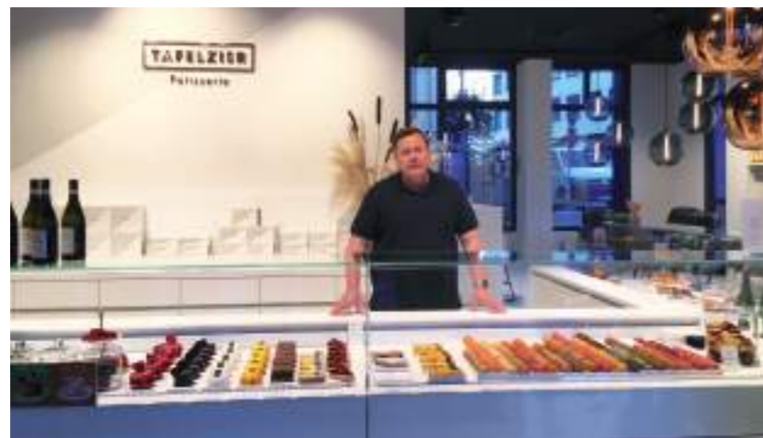
Süße Verführung der Patisserie Tafelzier | Bilder: Leckereien und Teilnehmer der Betriebsführung bei der Patisserie Tafelzier

Und das durften wir dann selbst „erschmecken“!