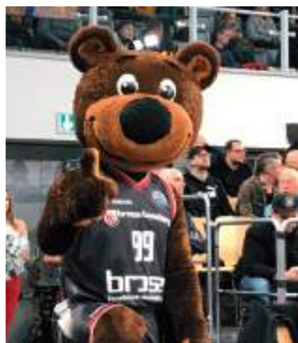
Bild: Maskottchen und Spieler von Brose Bamberg und Mitglieder der jungen Unternehmer Regionalkreis Nürnberg